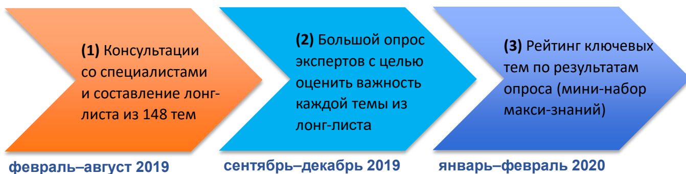
Схема организации опроса «Минимакс»

На первом этапе были проведены консультации со специалистами из самых разных областей науки и просвещения. Цель консультаций — выявить максимально широкий список тем, которые важны для понимания того, как устроен мир. По результатам сорока интервью со специалистами был сформирован лонг-лист — список из 148 тем. Этот список приведен в Таблице 1.